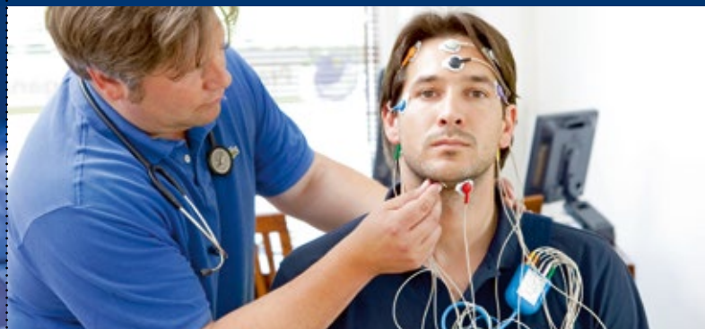
Große Schlafverkabelung (Polysomnographie)