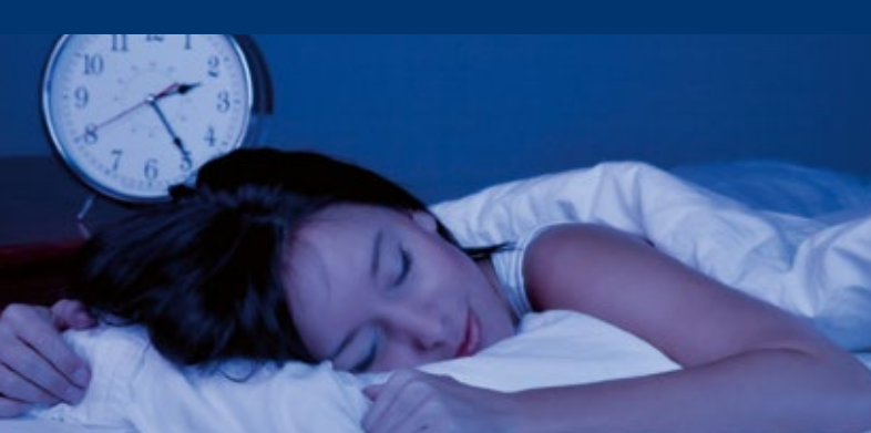
Endlich wieder erholsam schlafen...